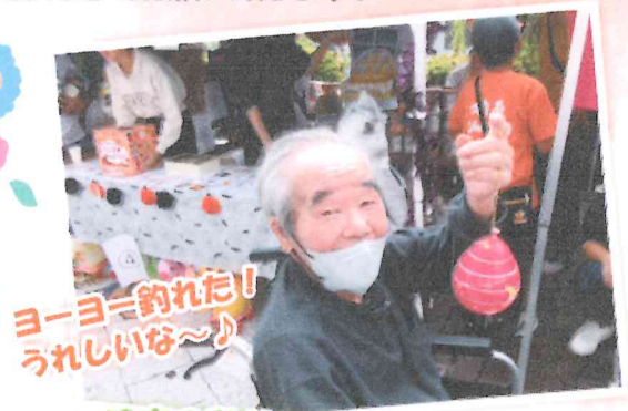
ヨーヨー釣れた! うれしいな~♪