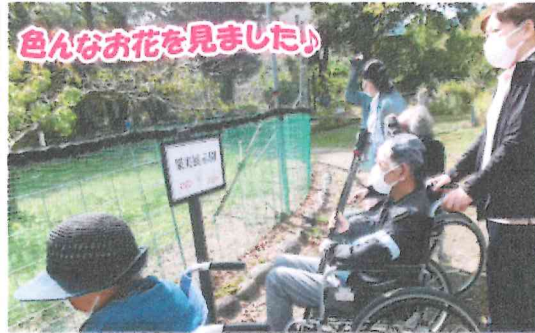
色々なお花を見ました!

令和6年8月1日に花畑ホームに新しく地域密着型サービスとして、グループホームが開設致しました。これもひとえに関係者様各位、入居者様、ご家族様、地域の皆様方のご支援の賜物と深く感謝申し上げます。入居者様へのより良い支援を目指し職員一同、力を尽くしてまいります。今後とも花畑ホーム アイナリーケア グループホームをよろしくお願い致します。