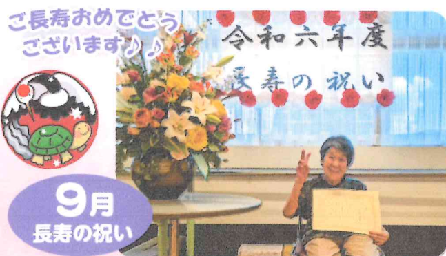
ご長寿おめでとう ございます!!