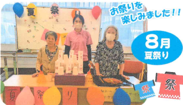
お祭りを楽しみました!!

デイサービスはご自宅から通っていただく、朝から夕方までのサービスをおこなっております。季節の行事や運動、体操、レクリエーションをし、お食事や入浴もされています。これからも地域に密着したサービスで皆様方の生活をお手伝いしていきたいと思っております。