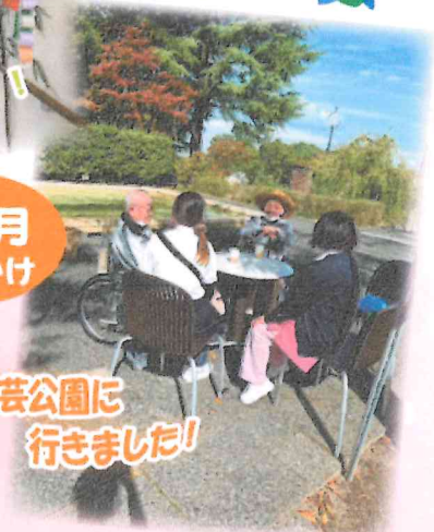
園芸公園に行きました!