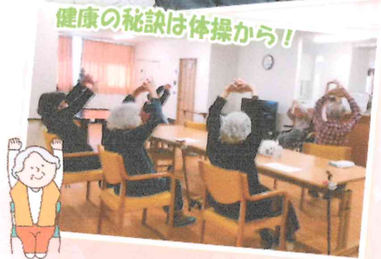
健康の秘訣は体操から!