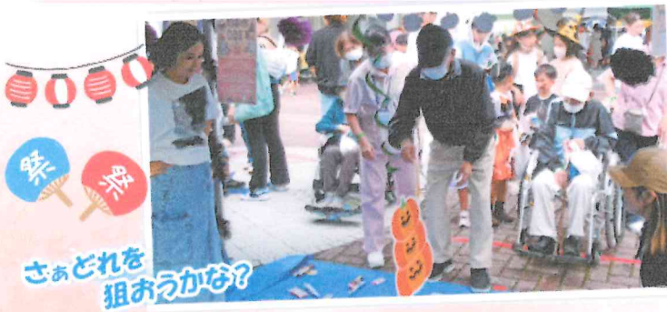
さあどれを狙おうかな?